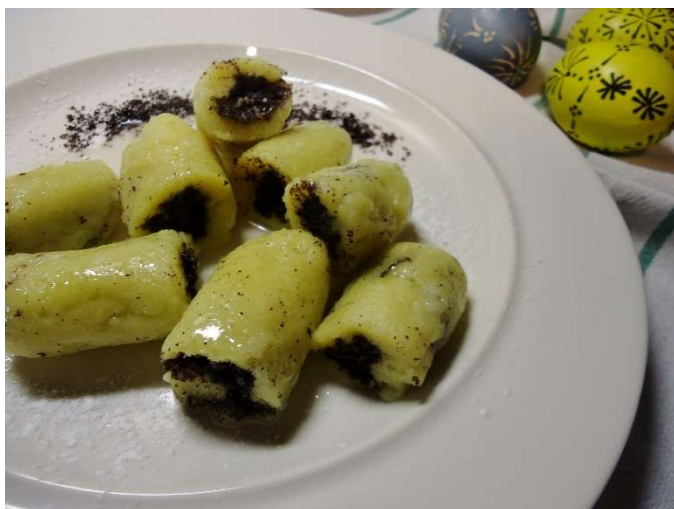
Plněné šišky s mákem, kompot