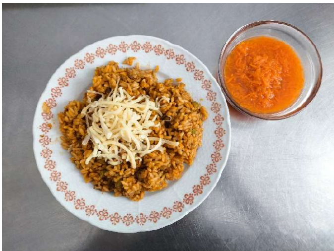
Vepřové rizoto sypané sýrem, salát