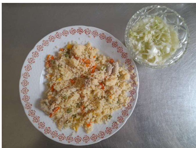
Těstovinový salát se šunkou a vejcem, pečivo