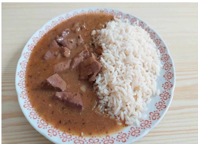
Kuřecí játra, bramborové tolárky, tatarská omáčka