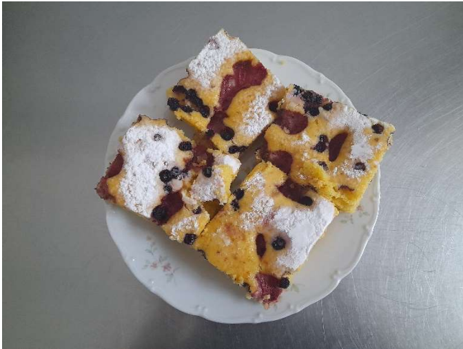
Bublancina s ovocem