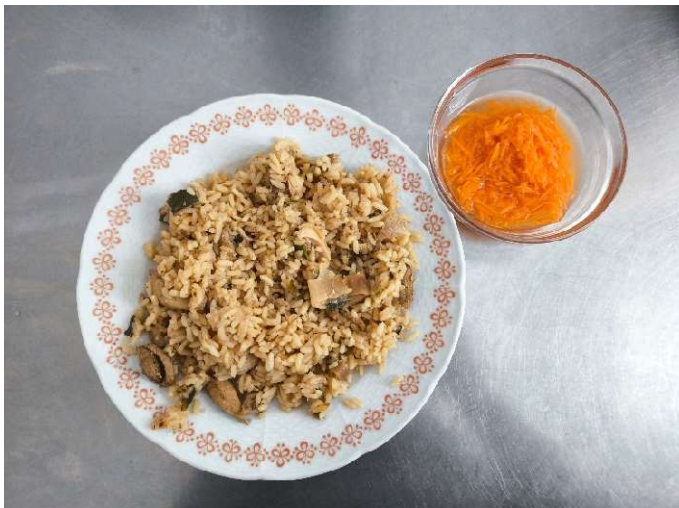
Smetanové kuřecí rizoto, salát