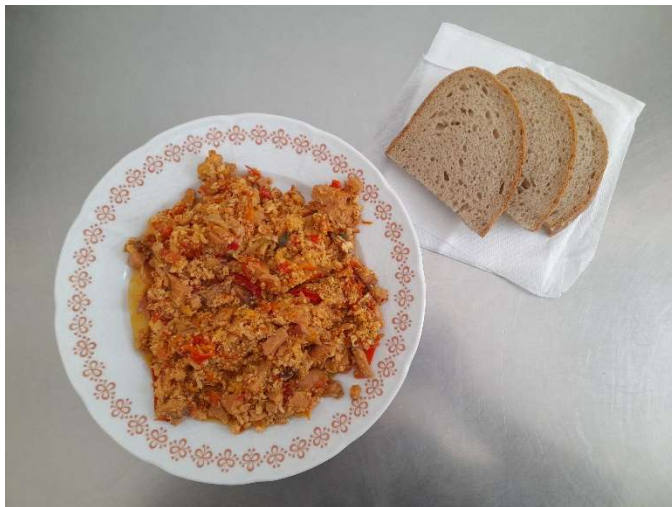
Lečo s uzeninou, chléb