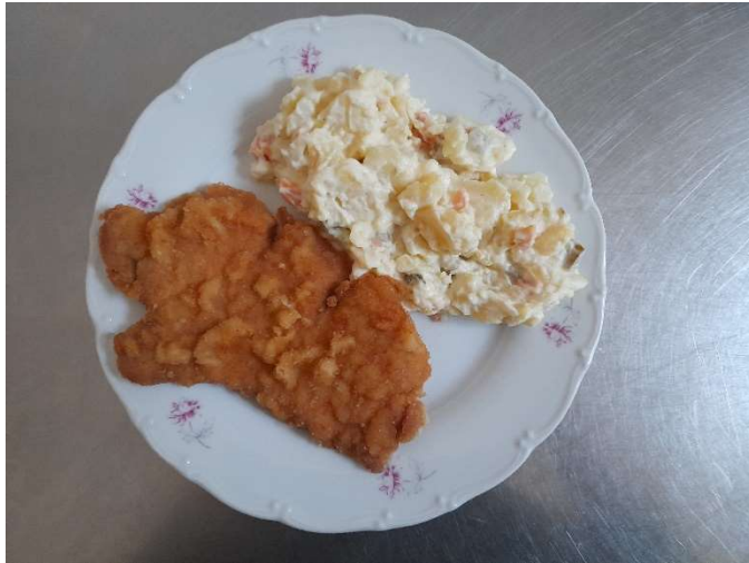
Smažený vepřový řízek, bramborový salát