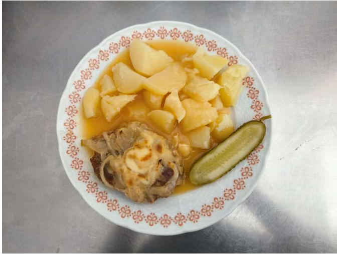
Farářovo tajemství, brambor, okurka