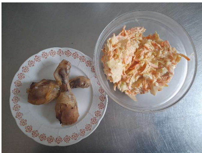
Kuřecí paličky, salát Coleslaw