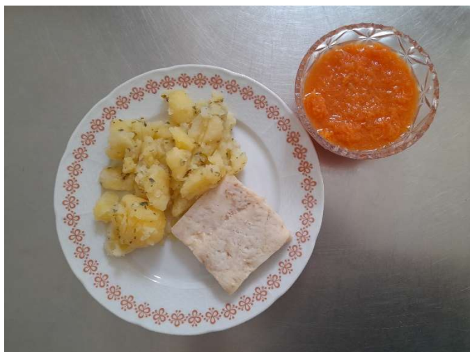
Rybí filé na rozmarýnu, brambor, salát