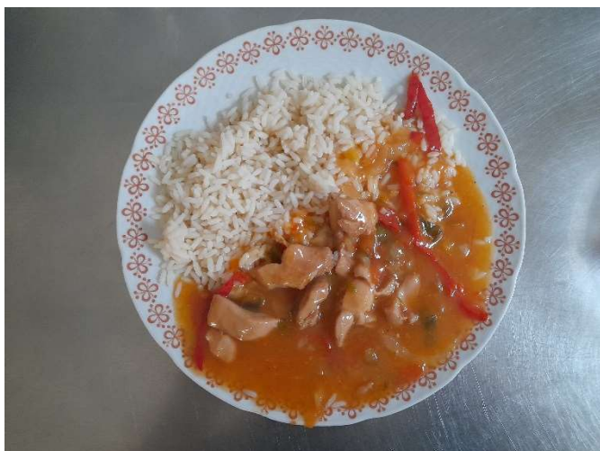
Pikantní kuřecí směs, rýže