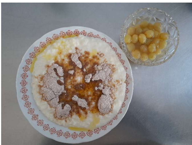
Rýžová kaše se skořicovým cukrem, kompot