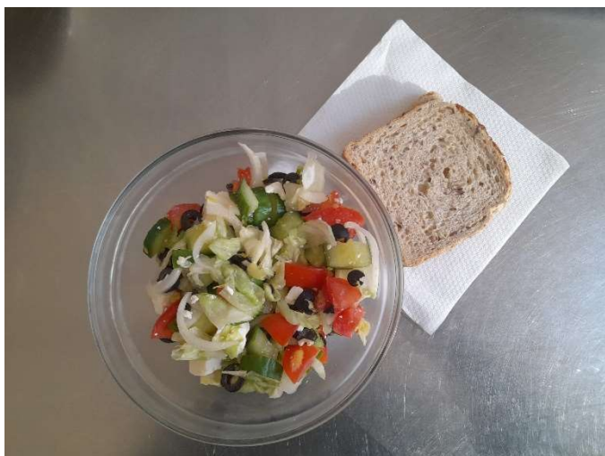
Šopský salát, pečivo