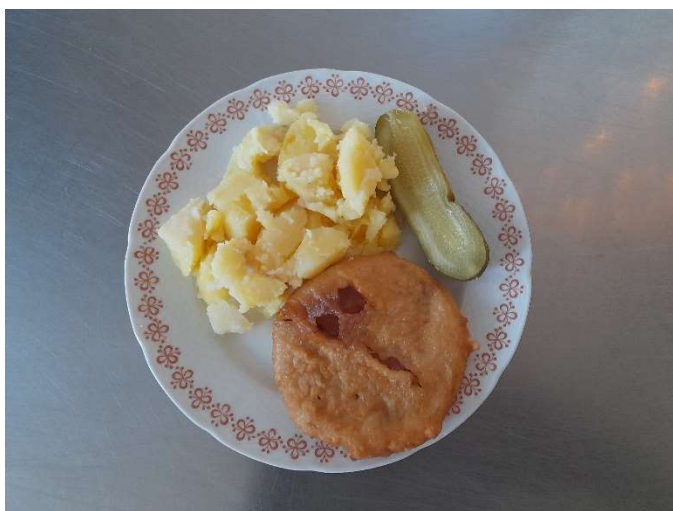
Salám v těstíčku, brambor, okurka