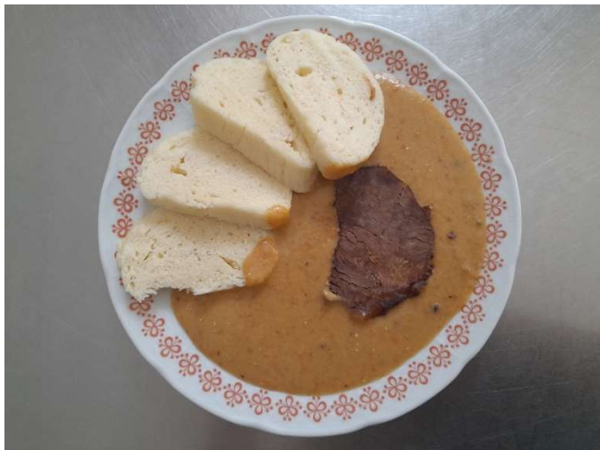
Svíčková na smetaně, houskový knedlík