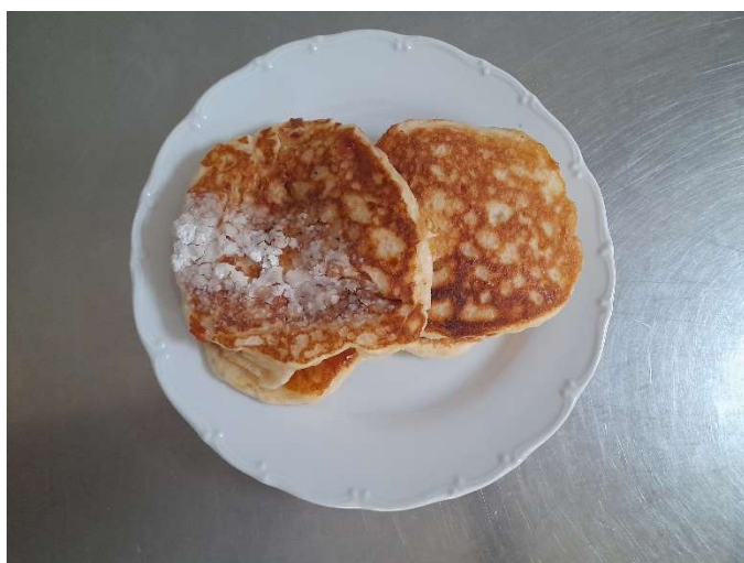
Lívance s marmeládou