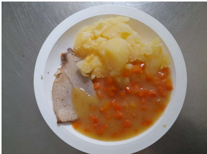
Vepřové maso v mrkvi, brambor