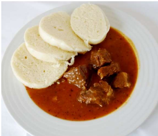
Mexická guláš, houskový knedlík