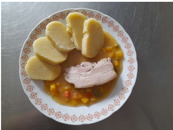
Pečený bůček na zelenině, bramborový knedlík