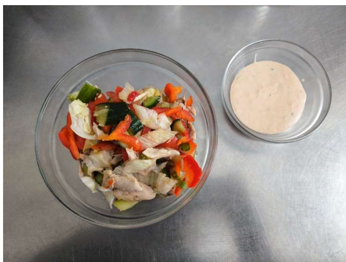
Zeleninový salát s kuřecím masem, dresing