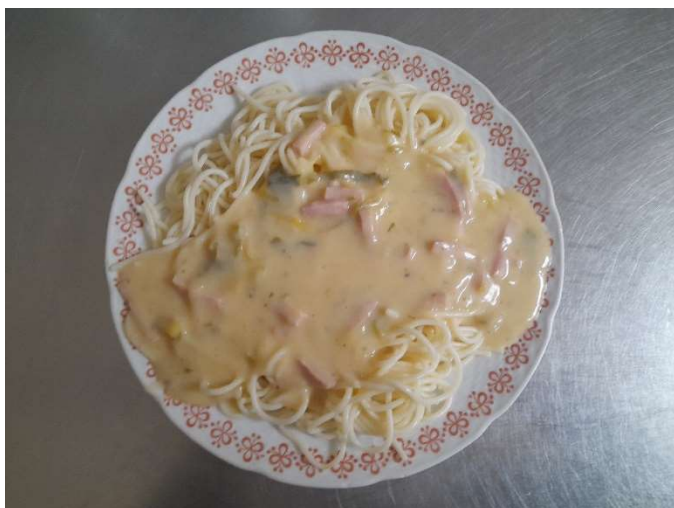
Smetanové špagety se šunkou a pórkem