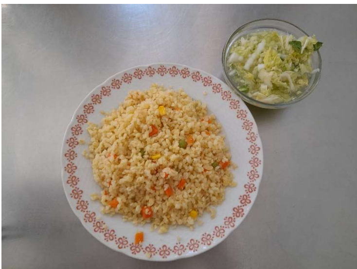
Zeleninové rizoto z bulguru, salát