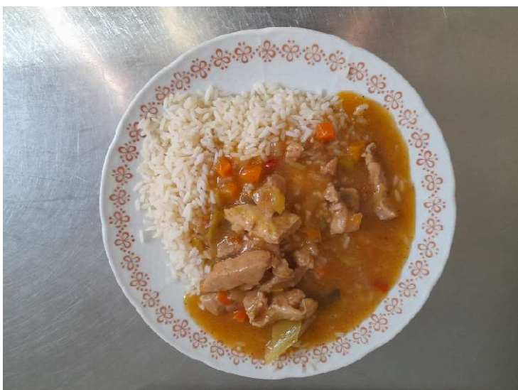
Katův šleh, rýže