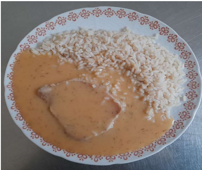
Vepřové žebírko lašské, rýže