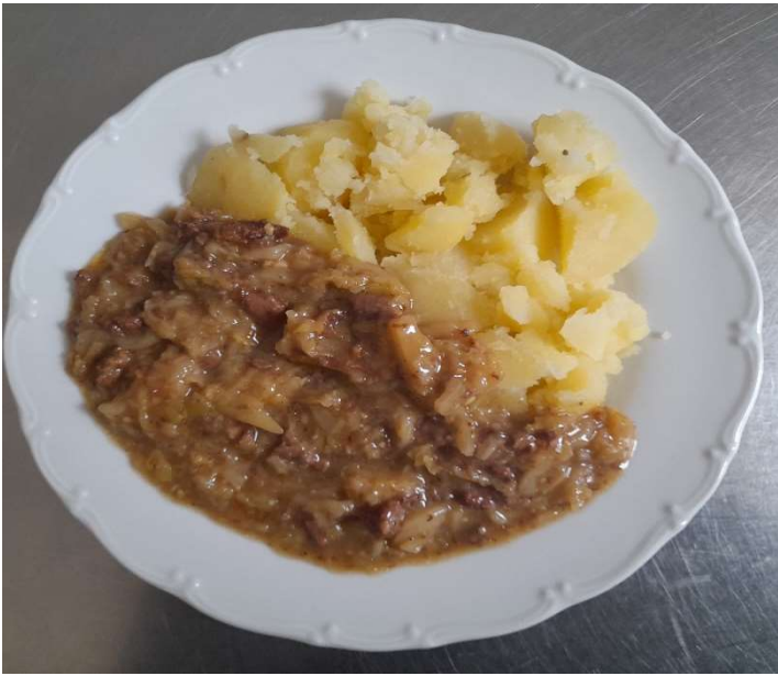
Hovězí maso v kapustě, brambor