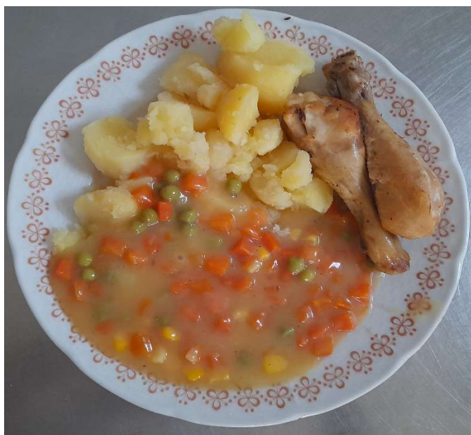
Pečené kuřecí paličky na zelenině, brambor