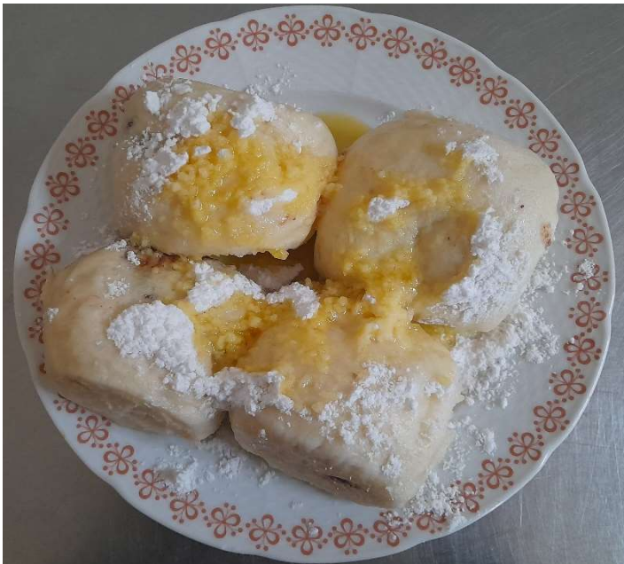
Kynuté knedlíky s meruňkami