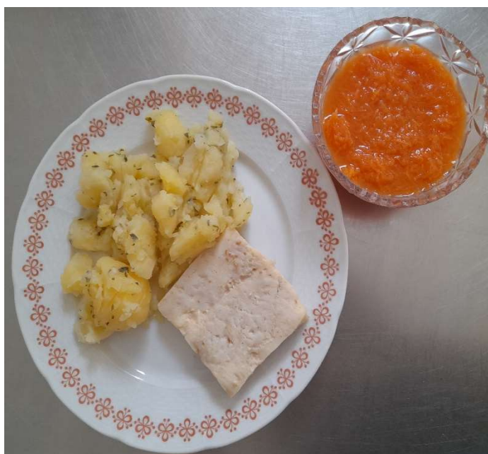
Rybí filé na kmíně, bylinkové brambory, salát