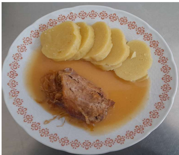
Záhorácký závitek, bramborový knedlík