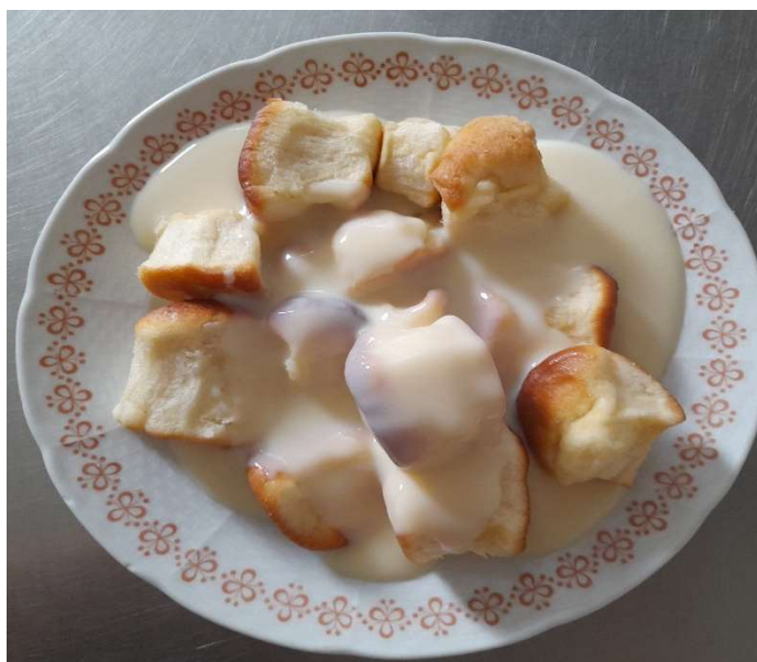
Dukátové buchtičky s vanilkovým krémem