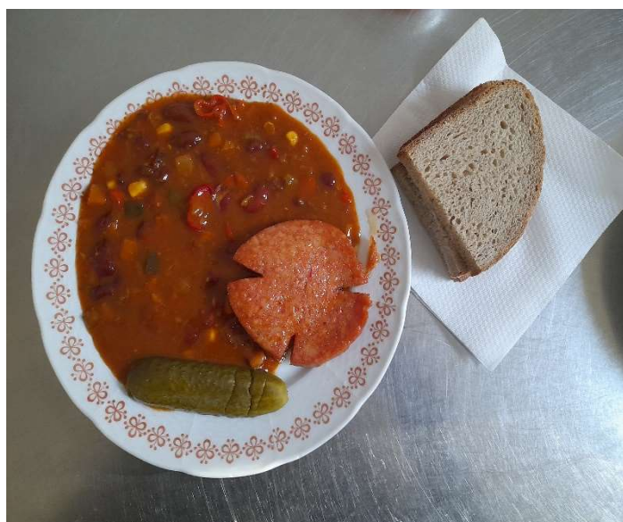
Mexické fazole s klobásou, chléb, okurka