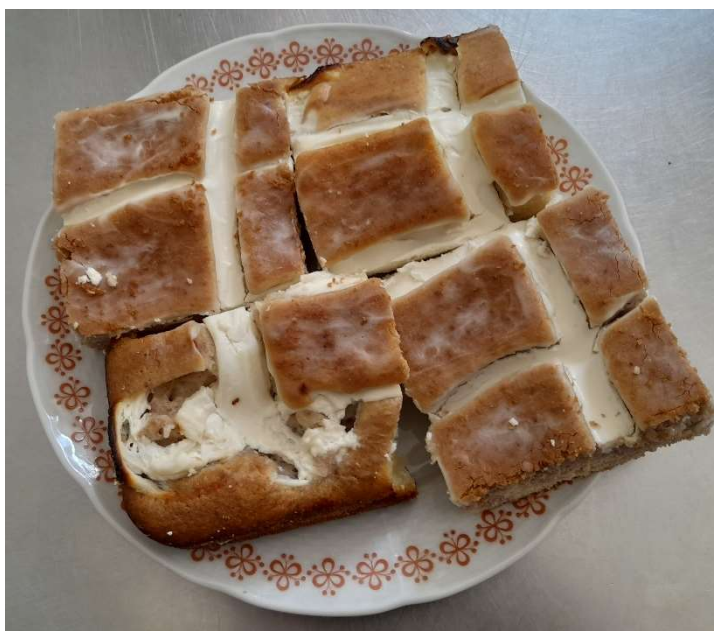
Perla řezy s tvarohem