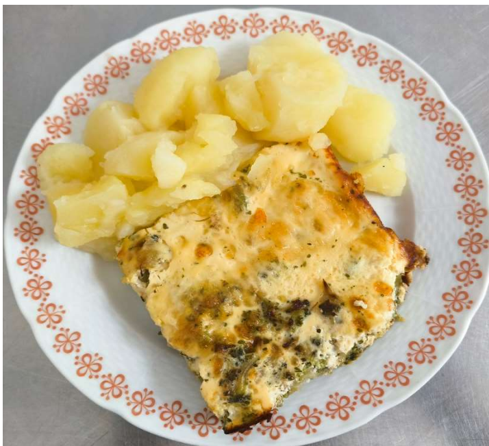
Zapečená brokolice se smetanou a sýrem, brambor