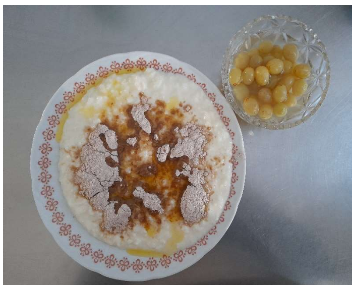
Rýžová kaše se skořicovým cukrem, kompot