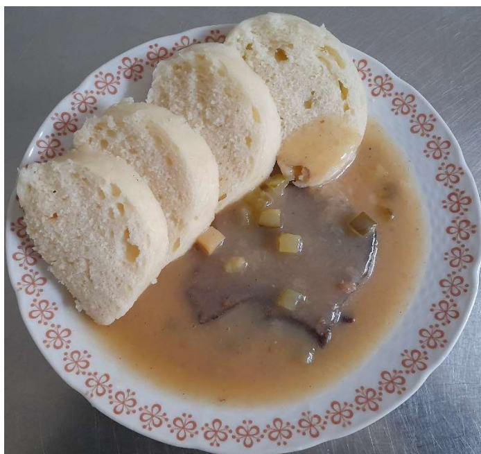
Znojemská hovězí pečeně, houskový knedlík