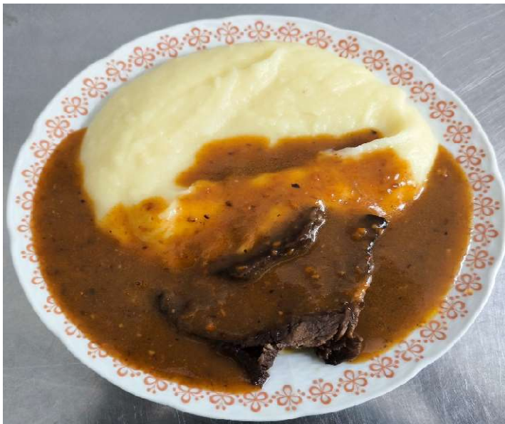
Hovězí líčka na červeném víně, bramborová kaše