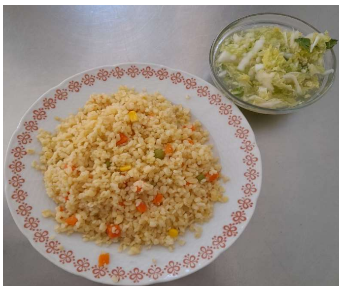
Zeleninové rizoto z bulguru, salát