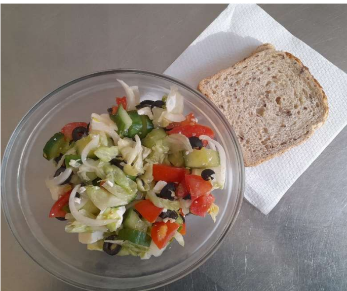
Řecký salát s balkánským sýrem a olivami, pečivo