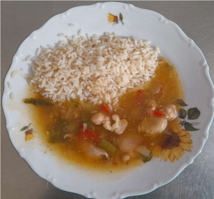
Kuřecí kung-pao, rýže